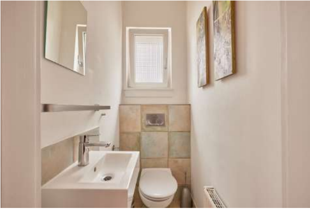
Gäste- WC EG