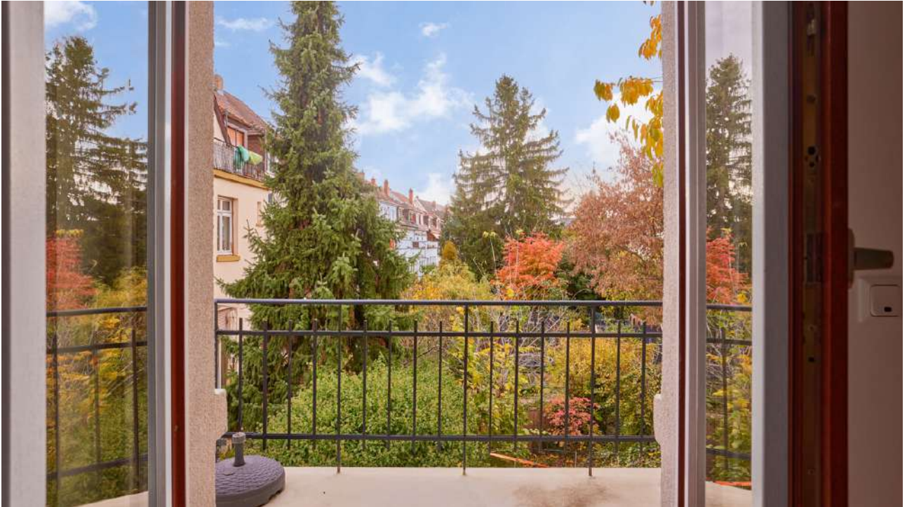
Blick Balkon- Gärten