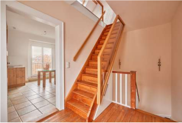
Küche mit Blick Treppe Galerie