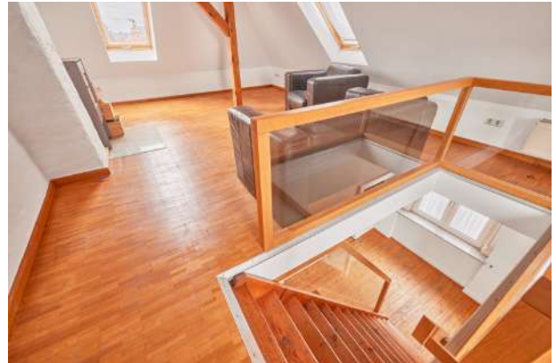
Galerie mit Blick DG