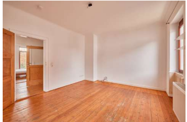
Zimmer DG 1