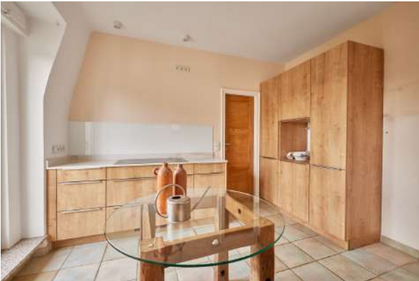
Küche mit Abstellraum